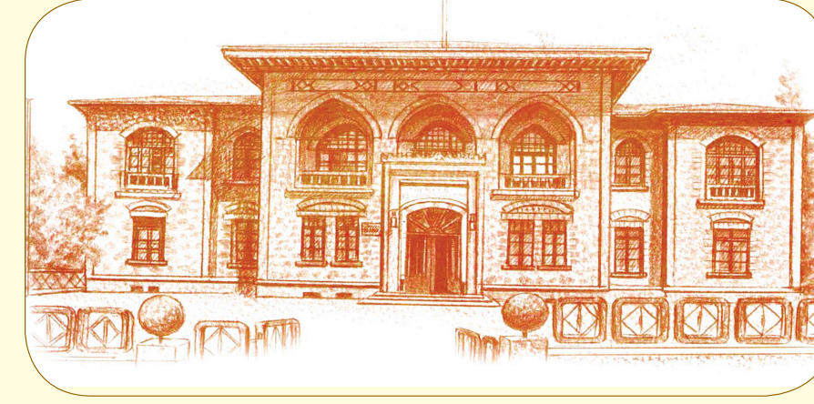
TBMM Binası, Ankara

2-6, 9, 16 ve 17'nci Mektupları telif etti.