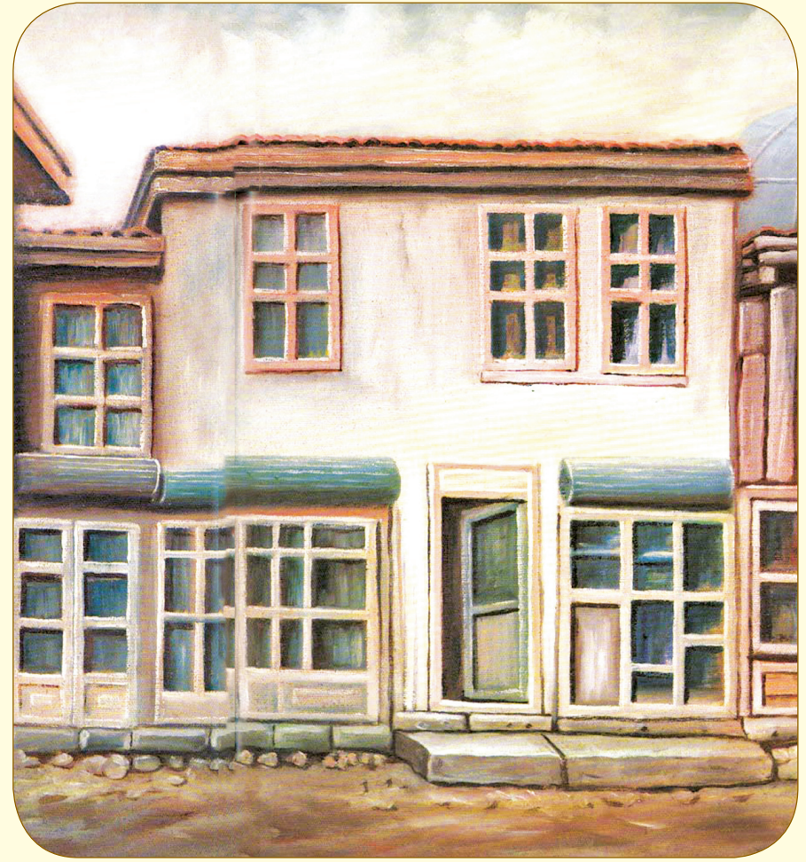
Afyon'da kaldığı ev