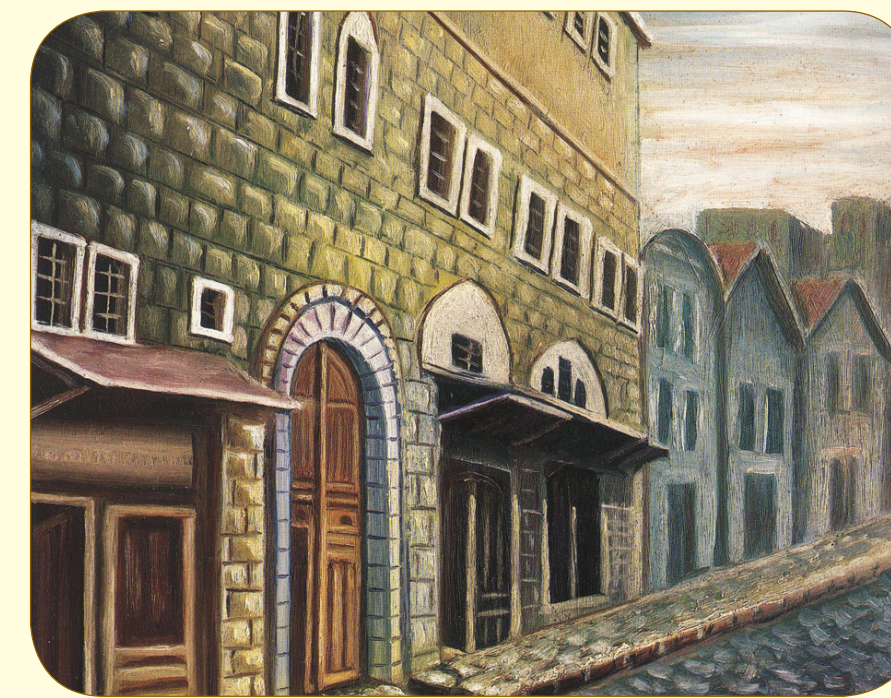
Şekerci Hanı, Fatih

İlk telifi olan "Talikat" ve "Kızıl İcaz" adlı iki eseri kaleme aldı.