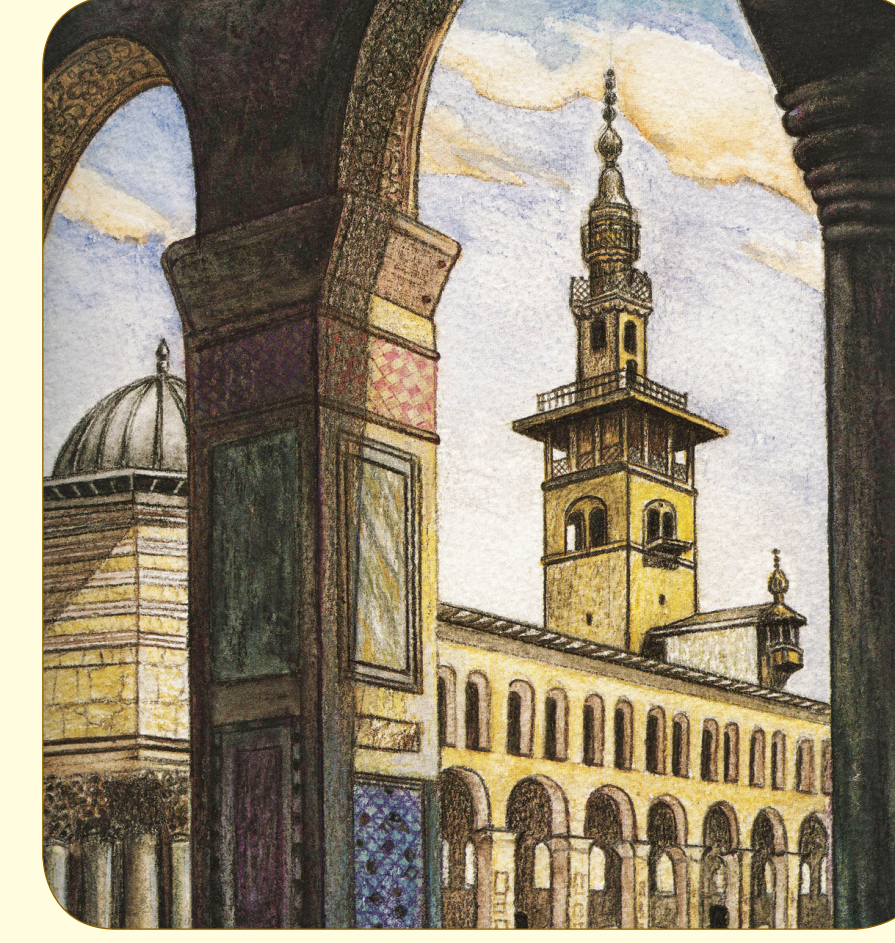
Camii Emevi, Şam

İslam dünyasını parlak bir istikbalin beklediğini müjdeleyen, sosyalizme hızlı adımlarla giden Çarlık Rusya'sının ise gelecekte yıkılarak parçalanacağını haber verdi.