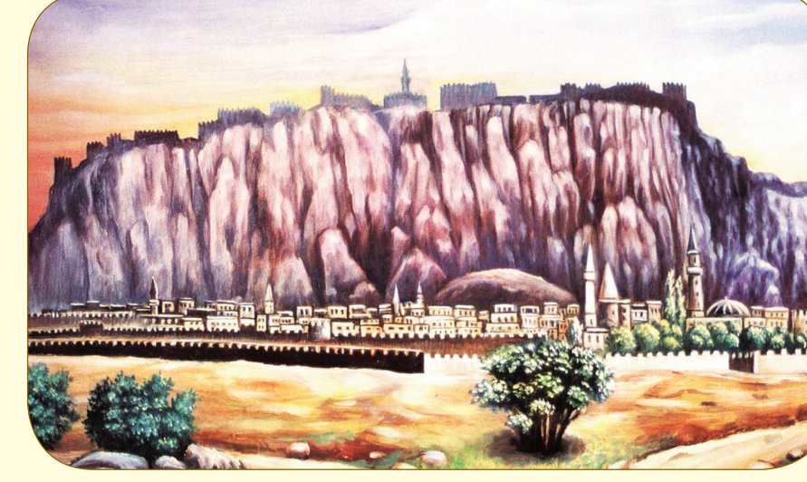
Eski Van Şehri

c) Daha önce başladığı kitap ezberlemeye Van'da da devam ederek hakâik-i İslamiyeden "Şerhü'l-Mevakıf", "Şerhü'l-Makâsıd" gibi doksan kitabı ezberledi ve üç ayda bir, hafızasından tekrarlamaya başladı.